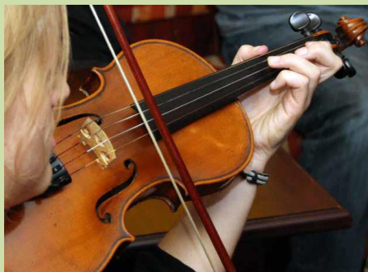
Alle Rechte vorbehalten

Die Workshop-Teilnehmer/innen werden „Tunes“ (Instrumentalstücke) und Lieder aus Schottland und Irland erlernen. Dabei werden die Stücke auf leichte und spielerische Art nach Gehör, also ohne Noten vermittelt. Im Rahmen des Irish Set Dancing wird von vier Paaren, die sich im Quadrat gegenüber stehen, zu mitreißender irischer Musik (Jigs, Reels, und Polkas) getanzt. Die Tänze bestehen üblicherweise aus drei bis sechs Figuren.