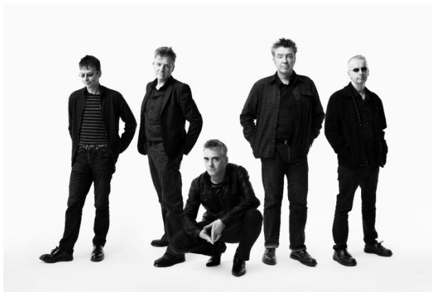
Alle Rechte vorbehalten

Die legendäre irische Pop-Punk-Band The Undertones tritt in diesem Monat in verschiedenen deutschen Städten auf – am 4. 11. in Stuttgart, am 5.11. in München, am 7.11. auf dem Rolling Stone Weekender im Ferienpark Weissenhäuser Strand (Ostsee) und am 8.11. in Berlin. Die Band wurde 1976 in Derry gegründet, bahnte sich ihren Weg durch die Punkjahre und trennte sich dann 1983, um andere musikalische Projekte zu verfolgen. 1999 formierte sich die Band mit Paul McLoone als Sänger neu. Auch heute noch reißt die Band bei ihren dynamischen Auftritten das Publikum mit, wenn sie ihre großen Hits wie „My perfect cousin“, „Here comes the summer“ und ihren wohl bekanntesten Song „Teenage Kicks“ spielt.